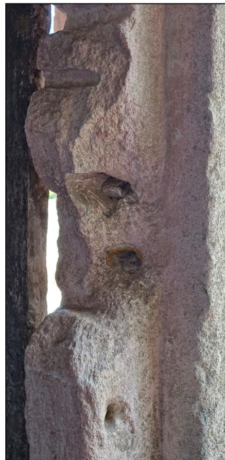
Fig. 3.6. Traces de gâches ?