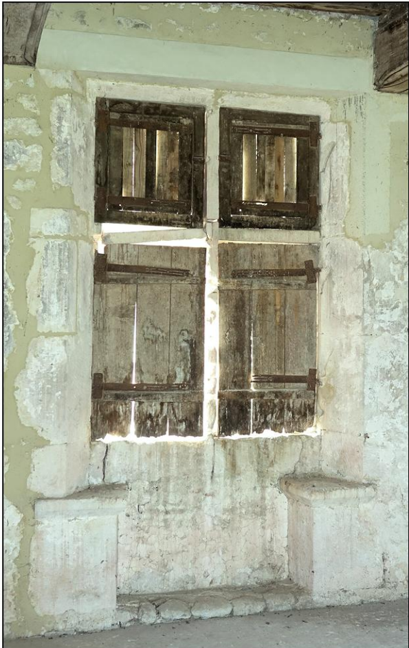
Fig. 3.1. Croisée