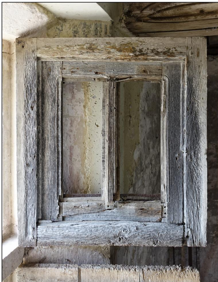
Fig. 3.5. Vantail vitré et volet (côté droit)