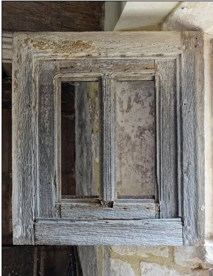
Fig. 3.2. Vantail vitré et volet (côté gauche)