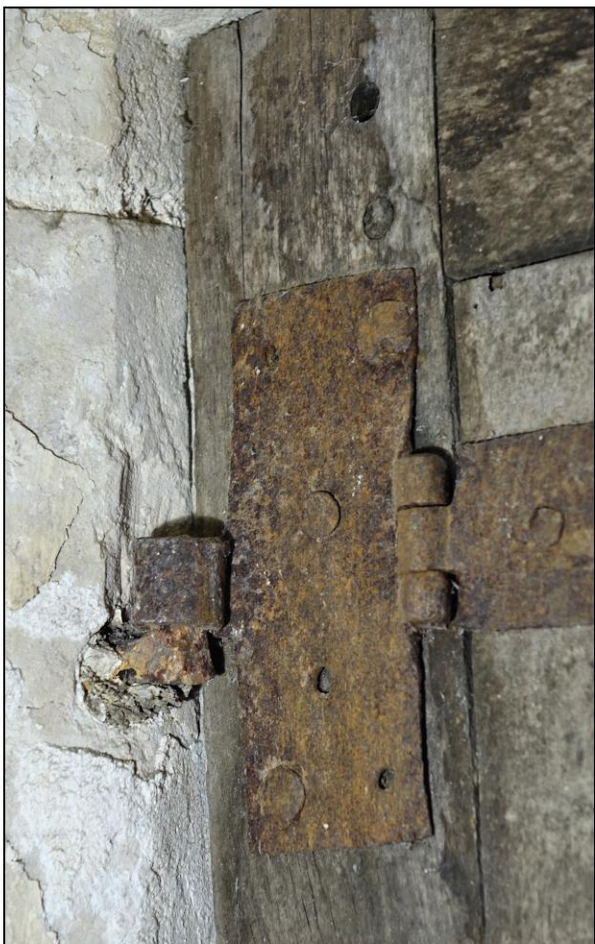
Fig. 3.4. Gond et penture à charnière