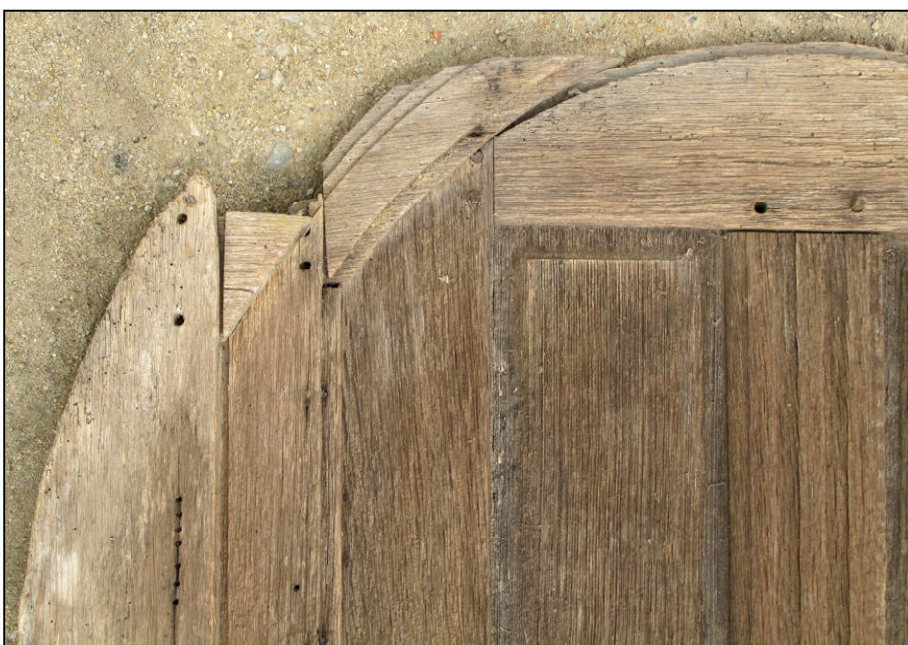
Fig. 5.3. Vantail et volet supérieurs (vue extérieure)