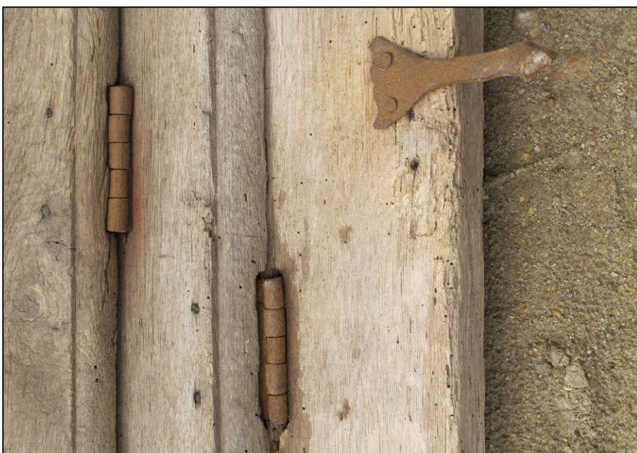
Fig. 5.5. Fiches et pattes à sceller