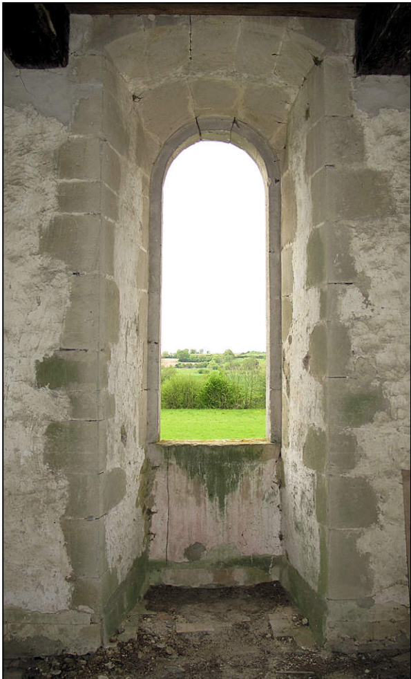
Fig. 5.1. Pavillon sud-est / fenêtre est