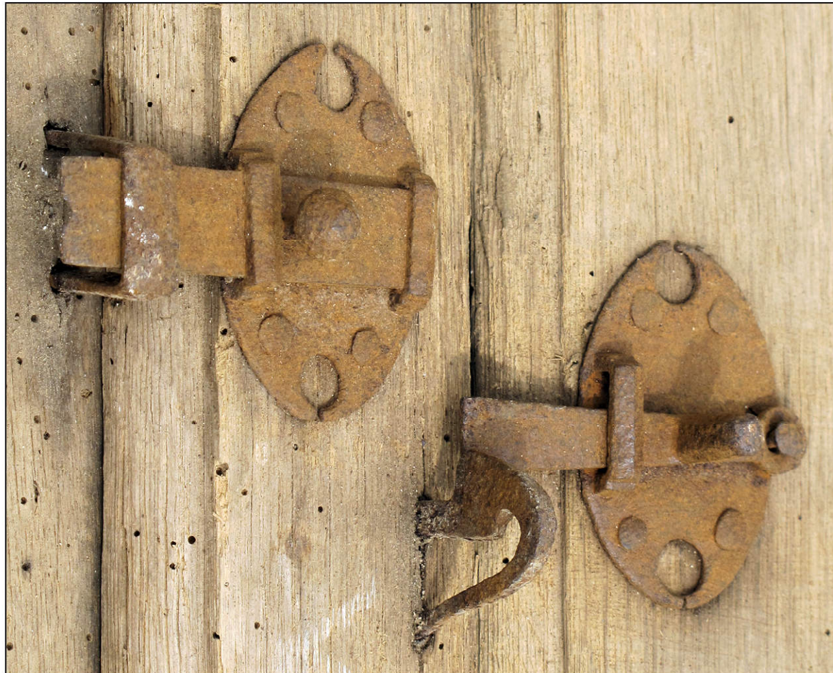
Fig. 5.2. Targette et loquet