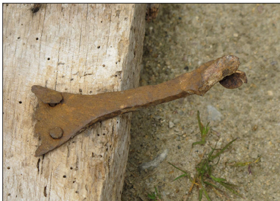
Fig. 5.6. Pattes à sceller