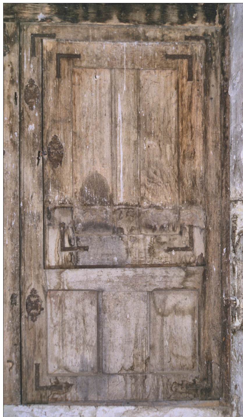
Fig. E.2. Vantail vitré et volet inférieurs droits

Comme nous l'avons souligné à plusieurs reprises, cette très belle croisée présente une conception et une facture classiques. La proportion de ses compartiments et l'adossement à un remplage de pierre demeurent traditionnels. Aussi, le panneauage de ses vantaux vitrés, ses assemblages au carré, la division de ses volets en panneaux hauts et étroits, la consolidation de ses bâtis par des équerres, l'adoption de fiches à broches rivées et la répartition de sa serrurerie qui sont en tous points comparables aux exemples proches de l'hôtel de Lantivy à Château-Gontier et du logis de la Joubardière, daté de 1612, permettent-ils de situer par analogie cette croisée à la fin du XVIe siècle ou plus vraisemblablement au début du suivant.