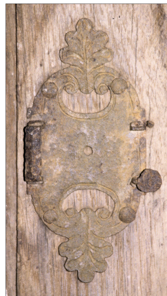
Fig. E.3. Platine de targette