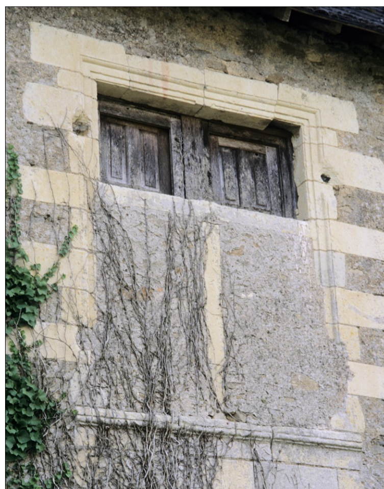
Fig. E.1. La fenêtre en partie murée

Assemblés au carré, à tenons et mortaises non traversées, ils sont installés à recouvrement sur les vantaux vitrés et divisés par un montant intermédiaire délimitant deux panneaux hauts et étroits de tradition médiévale. Les moulures arrêtées (chanfrein sur le cadre et quart-de-rond sur le montant médian), portées aux deux parements, permettent une bonne solidité de l'ensemble ; la qualité d'exécution également. Les panneaux sont du même type que les vantaux vitrés.